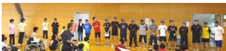
初参加のボランティアさん

チャレンジャーさん17名に対して、珍しくボランティアさんの数が上回り、卓球もバドミントンも～1人のチャレンジャーさんと3人のボランティアさんが組んだところもあり、県大の体育館がとても狭く感じました。