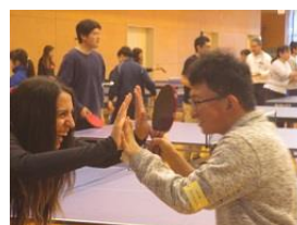
国際交流ハイタッチ