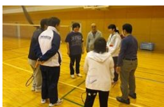
後半戦チーム分け