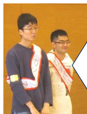
杉村母様のマッサージとガンバリスト賞