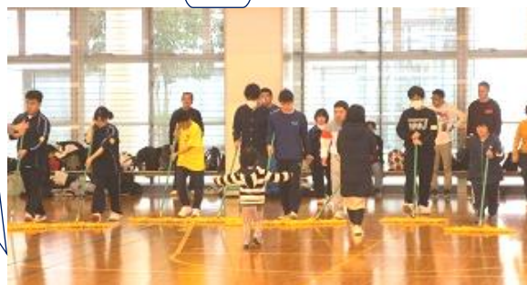
最後の清掃 モップ掛け