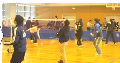
二月生まれの仲間