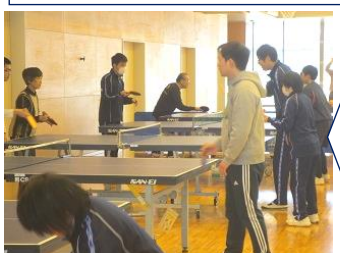
と卓球の部 バドミントンの部