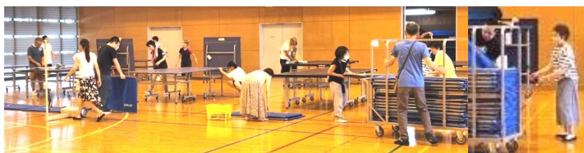
👤 片付け、保護者の協力 👶 お子様ボランティアによるシャトルの整理と支柱の片づけ