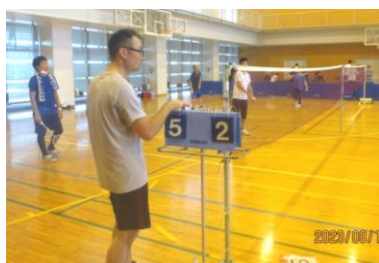
👍👍 手投げで上から打つ練習 得点板を出してゲーム