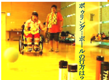
ボウリング・ボールの行方は？