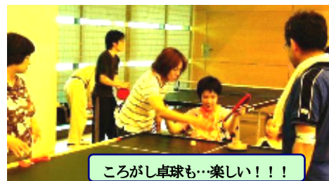
ころがし卓球も…楽しい!!!