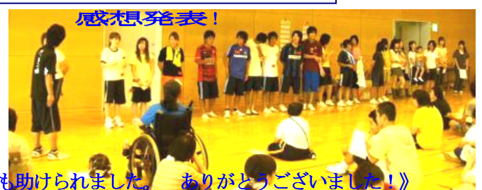
《暑い中、初参加のボランティアさんにも助けられました。ありがとうございました!》