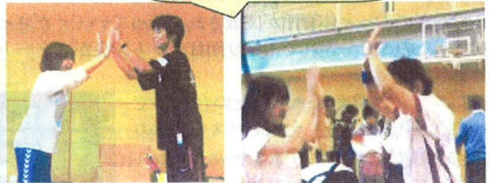
開始前のハイタッチ!