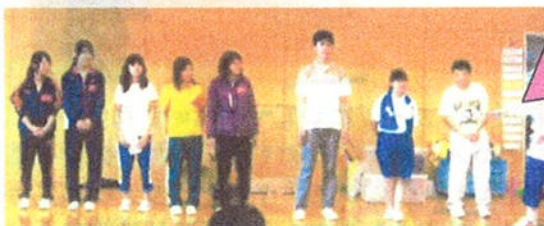
ボランティア 初挑戦者の感想!