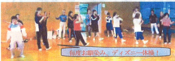
毎度お馴染み、ディズニー体操!