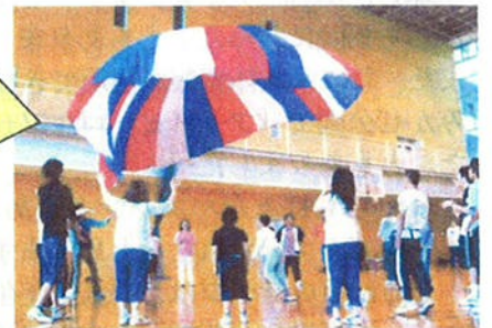
久しぶりに高く上がったパラシュート!