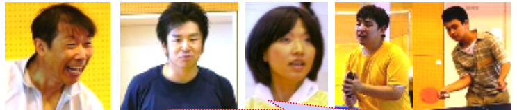
初参加ボランティアさん